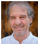
Leitung: Halko Weiss

Sowohl in therapeutischen, als auch persönlichen Beziehungen gibt es Wünsche und Sehnsüchte, für die gerungen, gehofft, und auf oft unbewussten Kanälen gewirkt wird. Wenn das nicht gelingt, verstärken sich unsere beschützenden Persönlichkeitsanteile, und gute Lösungen werden immer unwahrscheinlicher.