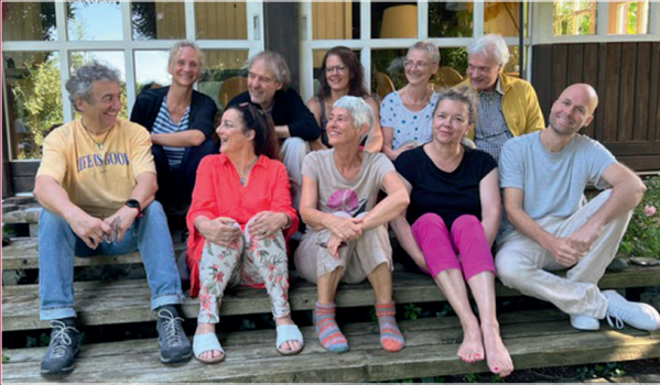
HAKOMI Lehrteamtreffen im Juli 2024 in Heigerding